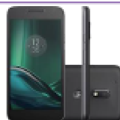
Motorola Moto G4 Play

à vista ou em 10x s/ juros Ou 24x de R$42,00