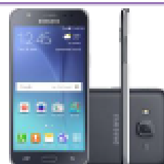
Samsung J500 - J5

à vista ou em 10x s/ juros Ou 24x de R$31,00