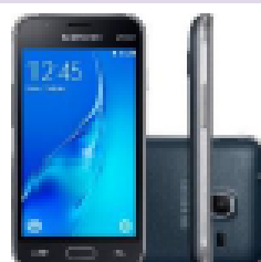
Galaxy J1 Mini

à vista ou em 10x s/ juros Ou 24x de R$23,00