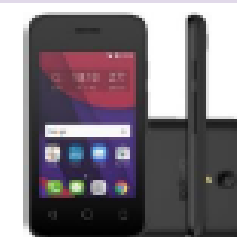
Alcatel 4009E Pixi 3.5"

à vista ou em 10x s/ juros Ou 24x de R$18,00