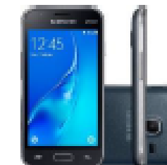
LG M250- K10

à vista ou em 10x s/ juros Ou 24x de R$67,00