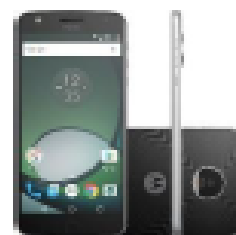
Motorola Moto Z Play

à vista ou em 10x s/ juros Ou 24x de R$113,00