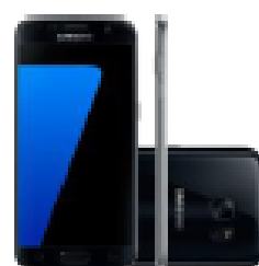
Samsung Galaxy S7

à vista ou em 10x s/ juros Ou 24x de R$125,00