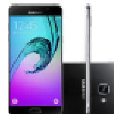
Samsung A720 - A7

à vista ou em 10x s/ juros Ou 24x de R$74,00