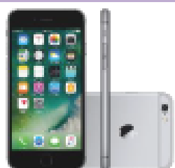
Iphone 6S 32GB

Algumas opções de aparelhos disponíveis: